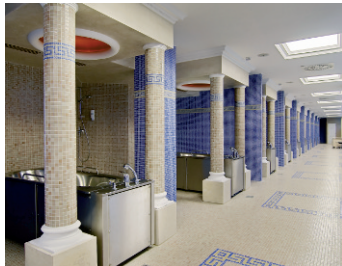
Kúpeľný dom Brusnianka