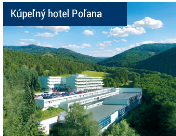
Kúpeľný hotel Poľana

Liečime aj kardiovaskulárne ťažkosti, orgánové poškodenie srdca a ciev po prekonaní COVID-19. Liečba je plne hrazená zdravotnou poisťovňou. Číslo indikácie II/12.